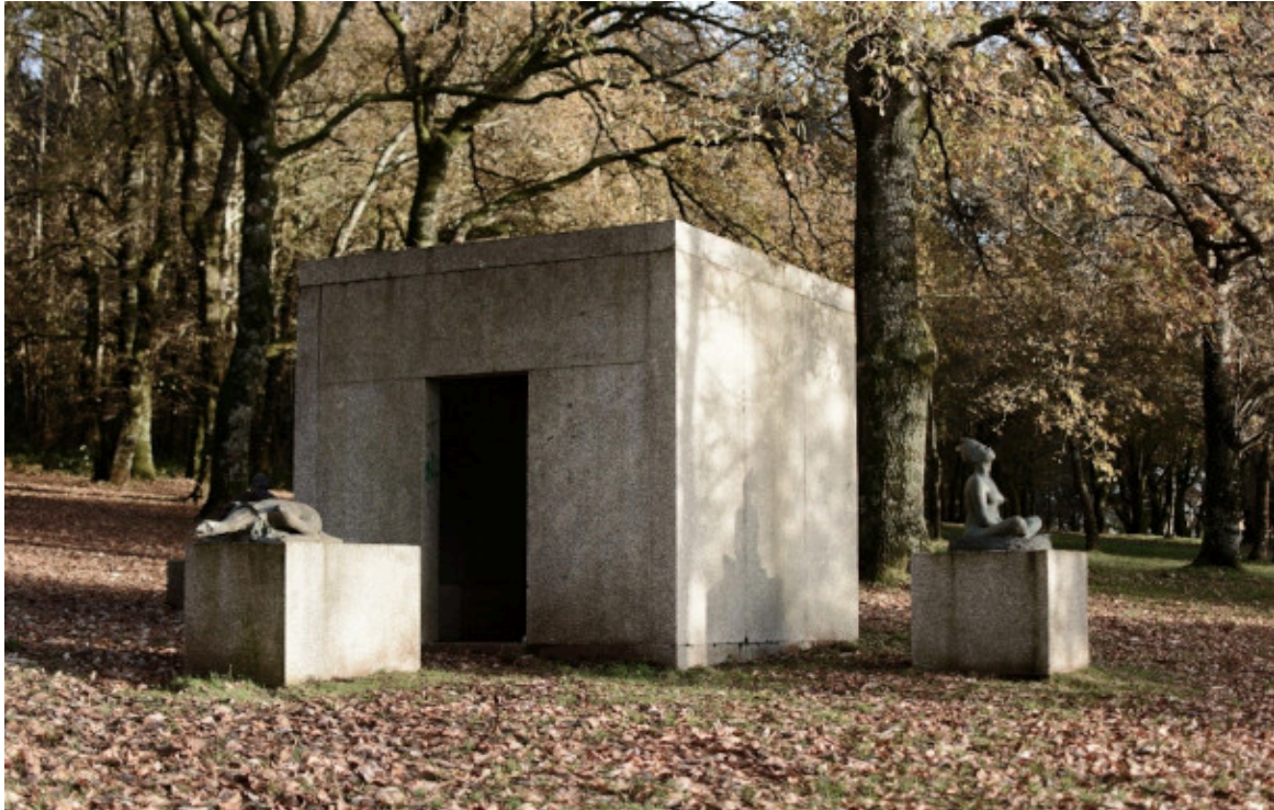
Fig. 17 César Portela, intervención sobre a carballeira de Lalín (2001).