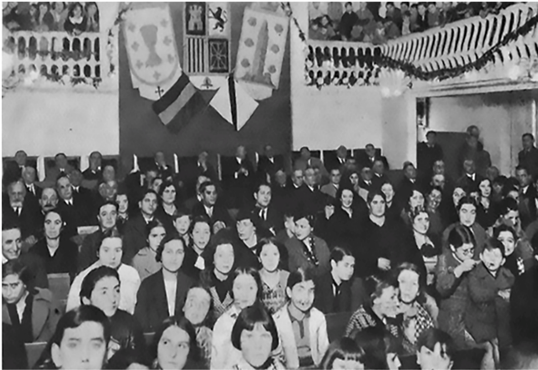
Fig. 4: Símbolos españois, neste caso bandeira e escudo republicanos, asociados aos de Galicia e A Coruña. Acto de entrega da “hucha de honor” ás Escolas Labaca, da cidade da Coruña, polo director do Instituto de Previsión. Vida Gallega , 20-02-1935, p. 13.

En definitiva, o emprego destes símbolos, ben acompañados dos da República, ou ben mostrados de xeito independente, por sectores que en grao variable podían manifestar unha identidade diferenciada da española, facía redobrar os dilemas simbólicos que afectaban aos estatais, no senso de que non era posible contar cun corpus oficial único e homoxéneo en todo o Estado.