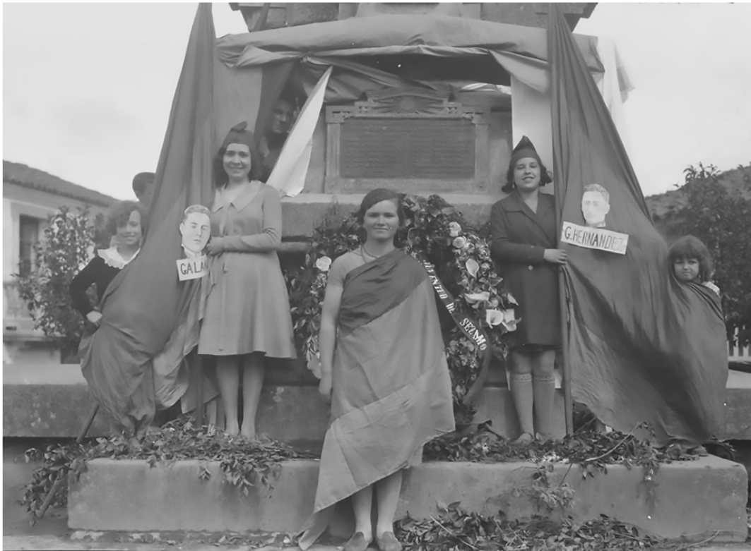
Fig. 2: As conmemoracións públicas foron ocasións axeitadas para a exhibición dos novos símbolos nacionais e constatar a conquista do espazo público polas novas autoridades. Na fotografía, unha moza vestida como bandeira tricolor acompañada doutras que tamén as portan en asociación aos novos mártires da liberdade: Galán e García Hernández. Outras fotografías do acto indican que as bandeiras brancas serían galegas.

Estes actos, como calquera dos antes citados, revisten grande importancia. Non era simples accións froito da éxtase da vitoria ou a rabia contra o pasado, e, se algo había diso, o seu significado