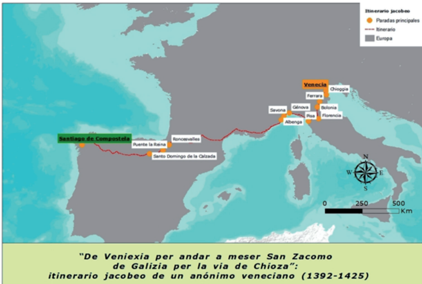
Figura 2. Itinerario de peregrinación do mais antigo relato italiano da peregrinación compostelana: De Venetia per andar a meser San Zacomo de Galizia per la via de Chioza (1392-1425).