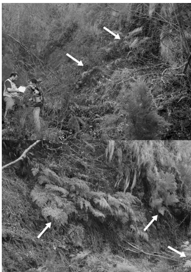
Figura 2.- Aspecto de las subpoblaciones de Culcita macrocarpa estudiadas. Arriba: FG-I; abajo FG-II. Las flechas indican algunos de los individuos integrantes de cada población

Culcita macrocarpa es un helecho de carácter higrófilo y umbrófilo cuyas poblaciones septentrionales ibéricas tienden a ser más numerosas y con mayor vitalidad bajo una cubierta arbórea densa y en las inmediaciones de pequeñas cascadas o tramos fluviales rápidos, en los que se mantenga un elevado grado de humedad atmosférica (Boudrie 1998, Prelli 2002, Quintanilla et al. 2004). De todas maneras, también puede crecer en formaciones vegetales que carecen de cubierta arbórea, siempre que se trate de