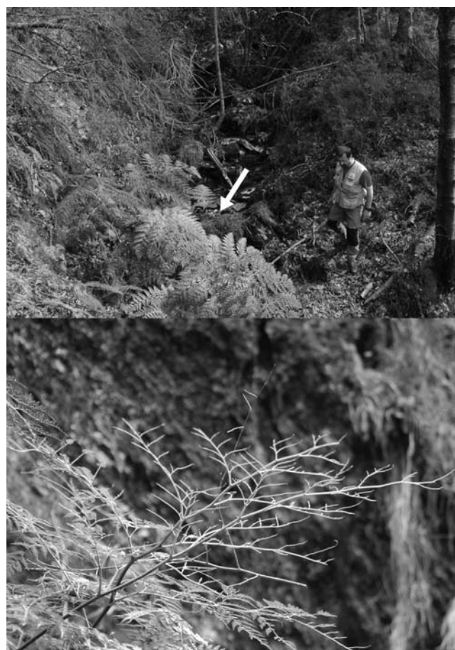
Figura 3.- Aspecto de la subpoblación FG-III (arriba) y de una fronde defoliada por un agente desconocido (abajo)