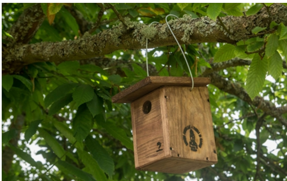
Figura 11.- Caixa niño instalada ao abeiro do apoio da marca de calidade Reservas de Biosfera Españolas Figure 11.- Nest box installed under the support of the Spanish Biosphere Reserves quality label

A metade pertencen ao sector hortícola (dispondo boa parte delas de certificación adicional en Agricultura Ecolóxica), seguidas das adegas de viño (integradas tamén na Indicación Xeográfica Protexida Viño da Terra de Betanzos e que utilizan a variedade autóctona recuperada “Branco Lexítimo”). Ademais hai empresas elaboradoras de marmeladas e conservas vexetais, plantas aromáticas e lácteos (Figura 12).