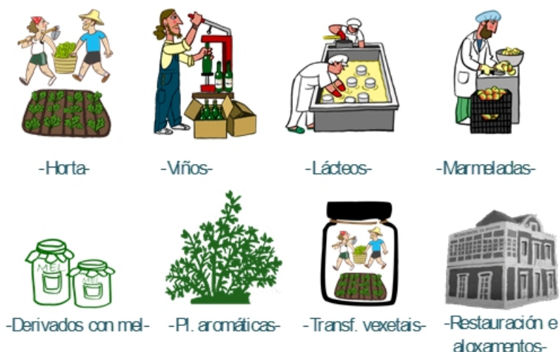
Figura 8.- Pregos de condicións en funcionamento actualmente na marca de Mariñas Coruñesas

Figure 7.- Main contents of the Regulations for the use of the Mariñas Coruñesas and Terras do Mandeo Biosphere Reserve label