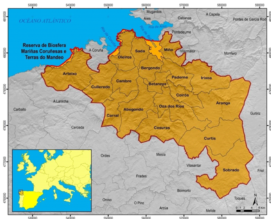
Figura 1.- Localización e municipios incluídos na Reserva de Biosfera Mariñas Coruñesas e Terras do Mandeo

Unha das características fundamentais das Reservas de Biosfera é o traballo en rede, de modo que todas as Reservas de Biosfera forman parte da Rede Mundial de Reservas de Biosfera, de cuxa administración se encarga UNESCO. Ademais existen redes de carácter nacional ou subnacional, como a Rede Española de Reservas de Biosfera ou a Rede Galega de Reservas de Biosfera, ou redes transnacionais ou redes temáticas. A Rede Española de Reservas de Biosfera está integrada por 53 espazos, que se distribúen por dezaseis comunidades autónomas, sendo tres Reservas de carácter transfronteirizo (Secretaría del Programa MaB & Organismo Autónomo Parques Nacionales, 2019). Deste conxunto, sete Reservas de Biosfera localízanse en Galicia, conformando a Rede Galega de Reservas de Biosfera. A máis antiga é a Reserva de Biosfera de Terras do Miño (2002), á que seguiron, por orde de declaración, a Reserva da Área de Allariz (2005), Os Ancares Lucenses e Montes de Navia, Cervantes e Becerreá (2006), a Reserva de Biosfera do Río Eo, Oscos e Terras de Burón (2007), a Reserva Transfronteriza Gerês-Xurés (2009), a Reserva de As Mariñas Coruñesas e Terras do Mandeo (2013) e finalmente a recentemente declarada Ribeira Sacra e Serras do Oribio e Courel (2021).