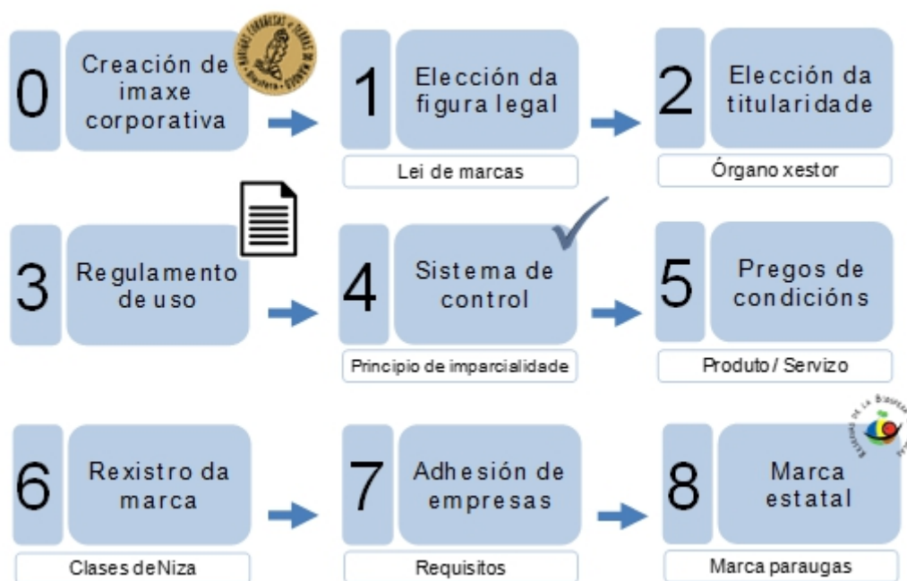
Figura 6.- Proceso de creación da marca de calidade Reserva de Biosfera Mariñas Coruñesas e Terras do Mandeo

0.- Creación da imaxe corporativa. Á marxe das distintas opcións e alternativas que adoita ofrecer un manual de imaxe corporativa, a imaxe da marca da Reserva de Biosfera deberá de ter concordancia coa propia imaxe da Reserva de Biosfera.