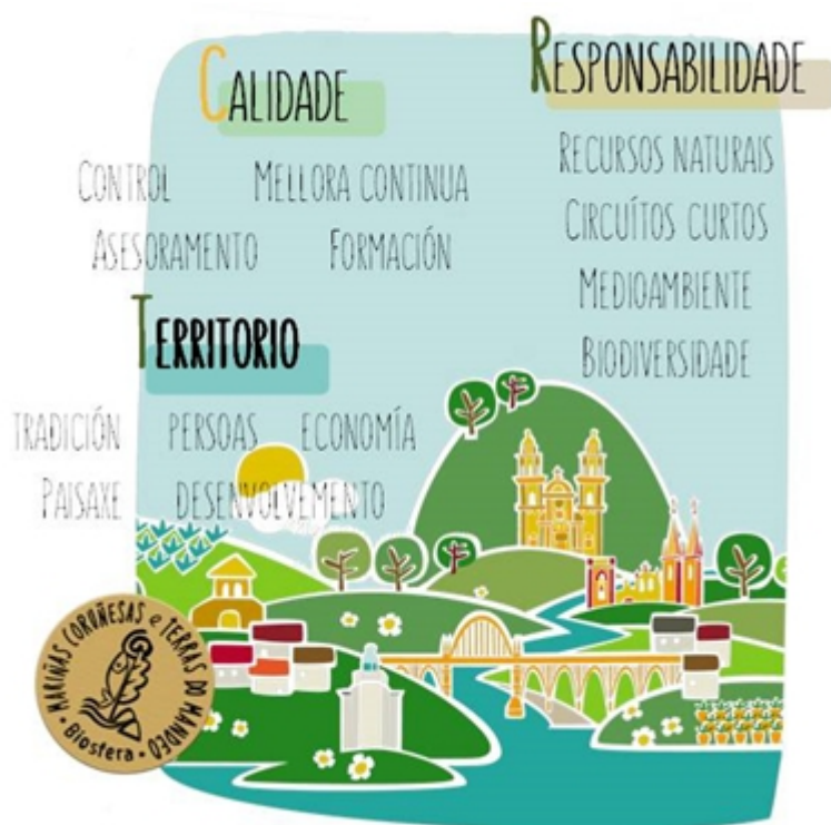
Figura 5.- Valores que pretende transmitir a Marca Figure 5.- Values that the label intends to convey

Como se crea a marca da Reserva de Biosfera?