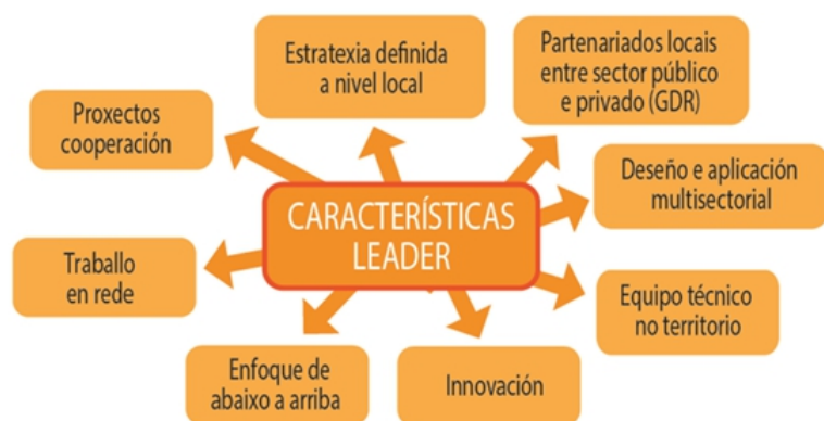
Figura 2.- Características da Metodoloxía LEADER Figure 2.- Characteristics of the LEADER Methodology

fondos para a súa execución, mediante un equipo técnico que acompañe todo este proceso a nivel territorial. Será clave tamén o establecemento de alianzas con outros territorios e actores que permitan traballar en rede e a aprendizaxe mutua (Blanco Ballón et al., 2016).