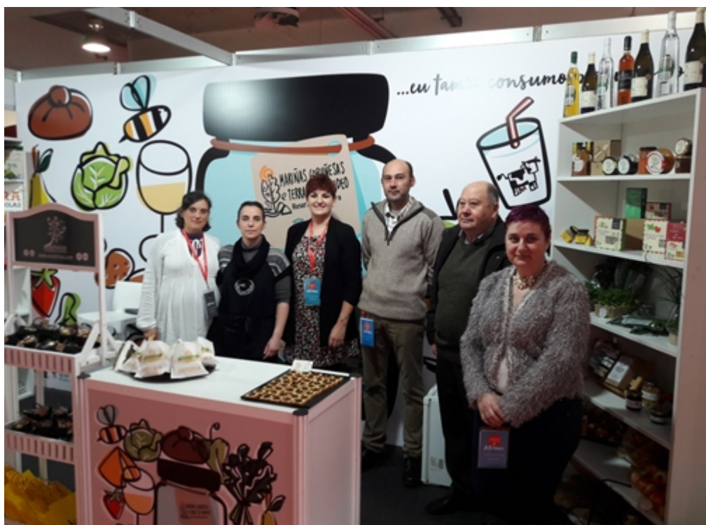
Figura 10.- Participación e feira gastronómica Figure 10.- Adherence process of companies to quality label