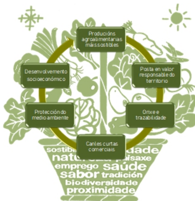
Figura 4.- Esquema gráfico das liñas de acción do Plan Alimentario da Reserva de Biosfera Mariñas Coruñesas e Terras do Mandeo Figure 4.- Graphic outline of the action lines of Mariñas Coruñesas e Terras do Mandeo Biosphere Reserve Food Plan

global, estando intimamente ligado co crecemento sostible (FAO 2021).