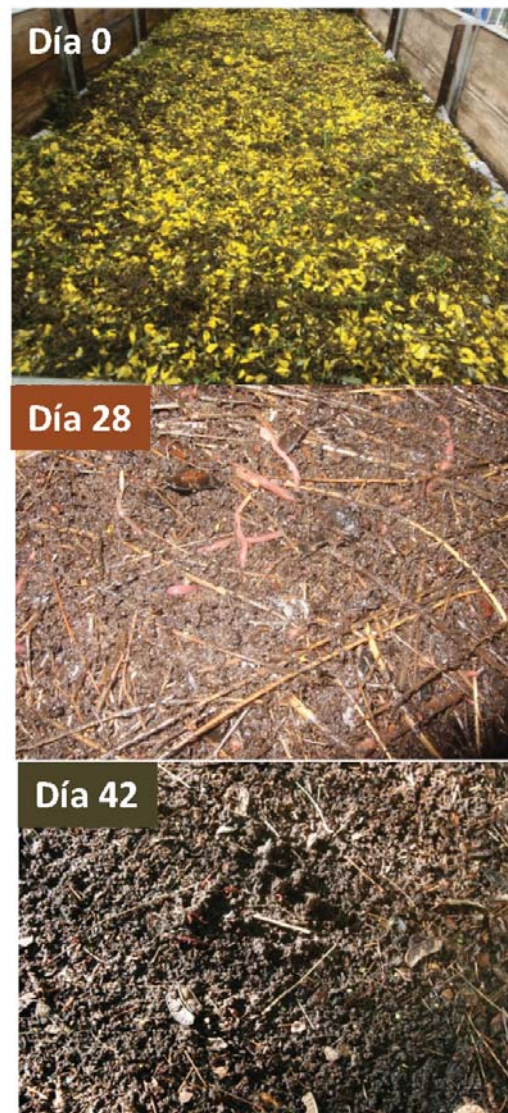
Figura 1.- Reactor de vermicompostaje de retama negra. Las imágenes muestran la evolución de la retama durante el proceso

El procesamiento de la retama negra tuvo lugar en un vermirreactor con una superficie de 6 m 2 (1,5 x 4 m) que contenía una cama de vermicompost maduro de 12 cm de espesor con una población total de lombrices de 280 ± 9 individuos m -2 , incluyendo 111 ± 10 lombrices maduras m -2 , 169 ± 7 juveniles m -2 y 120 ± 3 capullos m -2 , con una biomasa de 79,1 ± 5,2 g m -2 (Figura 1). Encima de la cama se dispuso una red plástica de 5 mm de luz de malla, que permite el paso de las lombrices a la capa de retama extendida homogéneamente sobre ella sin afectar de este modo al procesado del residuo y para facilitar la toma de muestras durante el proceso de vermicompostaje. La capa de retama, de 12 cm de espesor, se cubrió con una malla de sombra que reduce las pérdidas de agua, manteniéndola con una humedad óptima para las lombrices.