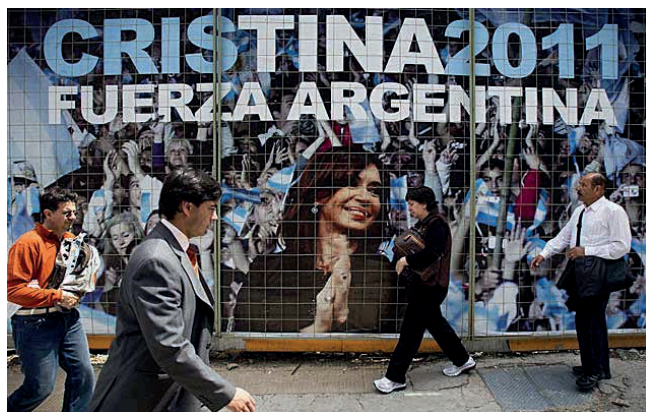
Cartel de campaña de 2011 de Cristina Fernández