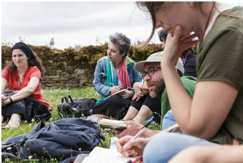
Unha das actividades do Programa de Estudos en Man Común.