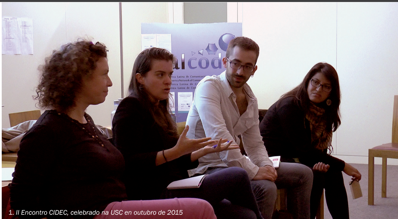
1. II Encontro CIDEC, celebrado na USC en outubro de 2015

Universidade de Santiago de Compostela (España)