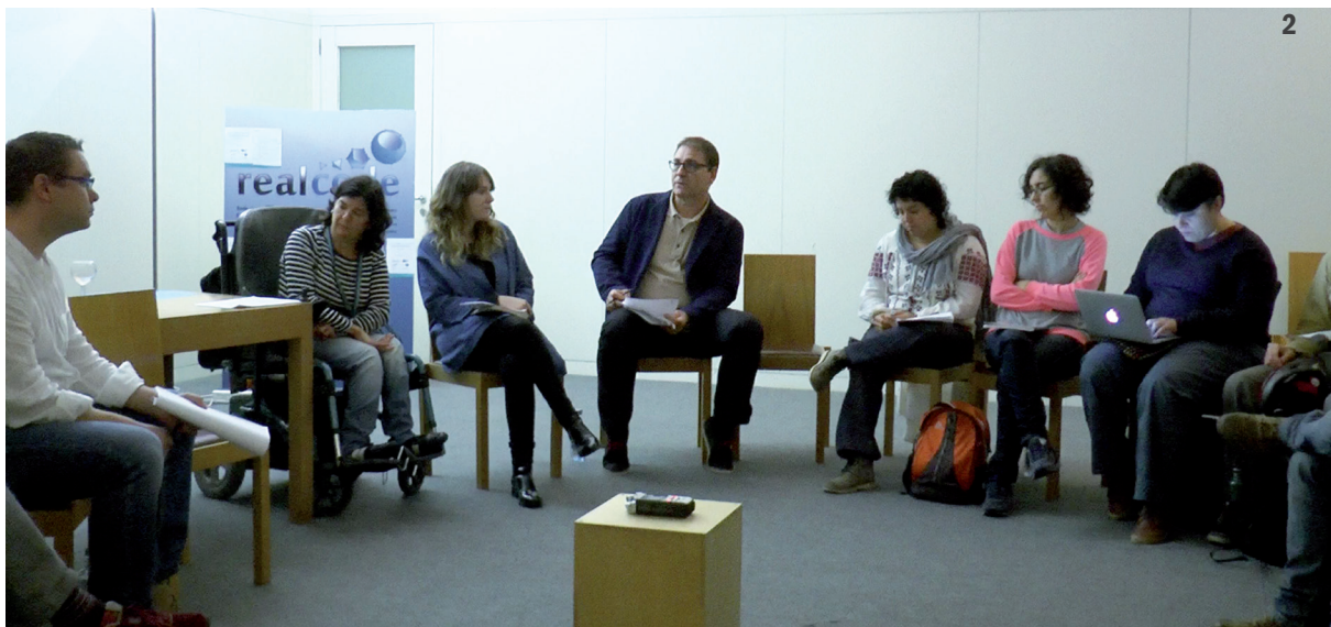
2. Investigadores e representantes de colectivos sociais no II Encontro CIDEC

coas formas institucionalizadas e de xestión da normalidade.