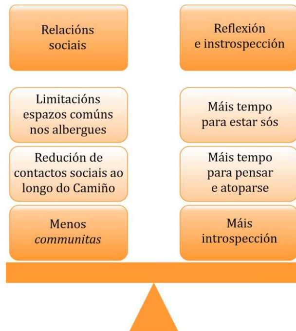
Figura 4. Posibles efectos do distanciamento social.