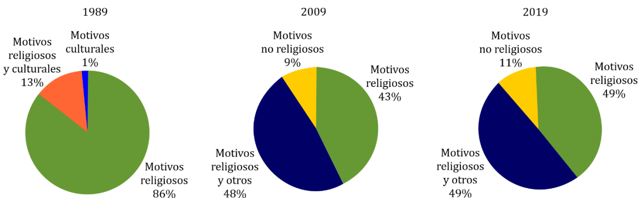
Figura 2. Evolución de la motivación de los peregrinos.

Por otro lado, existe la serie histórica producida por la Catedral, cuyas estadísticas siguen siendo referencia a la hora de aproximarse al número y al perfil de peregrinos (aunque con unas limitaciones). Los primeros datos recogidos se remontan al año 1989, cuando el 83,5% de los peregrinos que llegó a Santiago declaró haber realizado el viaje por motivos religiosos, el 12,6% por motivos religioso-culturales y solo el 1,5% por motivos culturales. Veinte años después (en 2009), las motivaciones religiosas son indicadas por el 42,6% de los peregrinos, el 48,2% declara razones mixtas relacionadas con motivaciones religiosas, y el 9,2% afirma haber hecho el Camino sin ninguna motivación religiosa. En 2019 3 , no se registran cambios significativos, ya que un 48,7% indica haber hecho el Camino por motivos religiosos y otros, un 40,3% exclusivamente religiosos, y un 10,98% no religiosos (Figura 2).