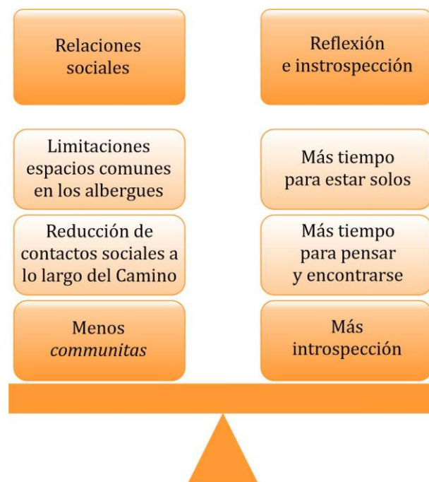
Figura 4. Posibles efectos del distanciamiento social.