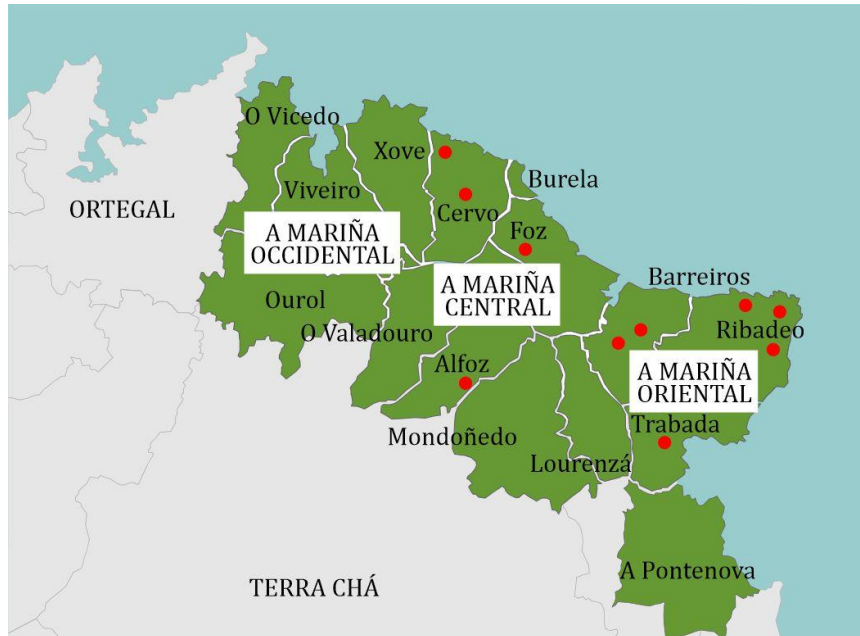
Figura 1. Distribución xeográfica das entrevistas en profundidade realizadas.