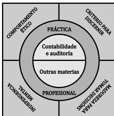
Figura 1.- Formación e competencias do auditor

Na figura 1 represéntase a relación entre coñecementos e competencias, aplicados ao caso concreto do auditor. Os coñecementos achégaos, principalmente, o currículo académico, as habilidades teñen que ver con saber aplicar estes coñecementos en situacións reais, que veñen proporcionadas pola práctica profesional previa á autorización para exercer.