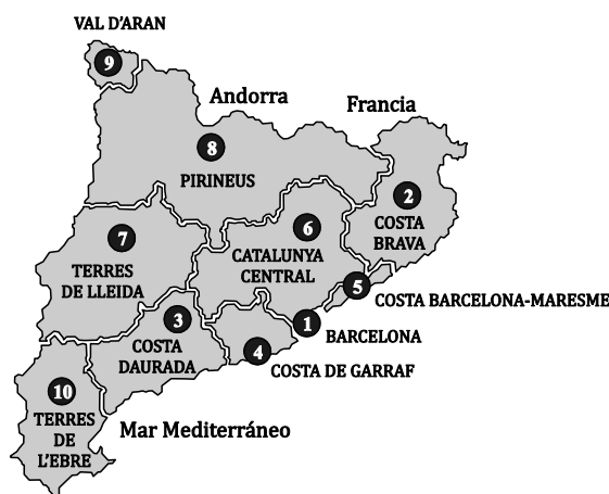
Mapa 1.- Marcas turísticas catalanas

La Ley 13/2002, de 21 de junio, de Turismo de Cataluña establece como primer objetivo de la Generalitat promover Cataluña como una marca turística global, que integre y respete el resto de marcas catalanas (artículo 28). Se reconoce la existencia de diez grandes marcas turísticas (mapa 1), cada una de las cuales puede disponer de su logotipo y de un órgano de gestión propio 5 .