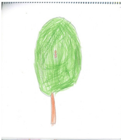
Figura 1. Dibujos infantiles