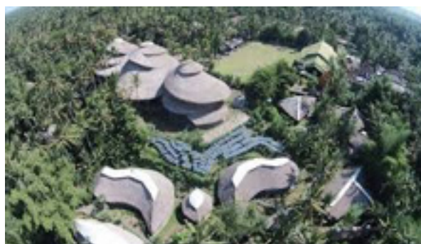
Imagen 9: Campus Green School de Bali.

Los estudiantes, además de seguir algunas asignaturas tradicionales, también participan en la agricultura, con jardines de cultivo de frutas y hortalizas, o en la producción de aceite de coco de los árboles de campus, la cosecha de miel y la cría de peces en los estanques de acuicultura.