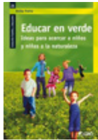
Imagen 11: Portada del libro "Educar en verde", de Heike Freire.

Tras la visita inspiradora a estas iniciativas, queremos volver la mirada hacia los contextos más habituales, la familia y la escuela, desde las que se debe fomentar el contacto y respecto al medio natural. Por ello hablaremos de ideas para acercar a niños y niñas a la naturaleza.