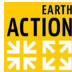
Imagen 14: Logo Earth Action.

La World Wide Fund for Nature (WWF), es una de las mayores organizaciones internacionales de conservación de la naturaleza, pionera en educación ambiental, a través de novedosos proyectos educativos basados en el desarrollo sostenible y la conservación, llegando a más de diez mil centros educativos.