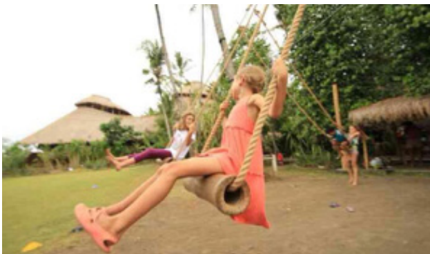
Imagen 6: Tiempo de juegos en la Green School de Bali.

Una de las más reconocidas Green School se encuentra en Bali, Indonesia, en la que se dispensa una educación natural, integral y centrada en los estudiantes, en uno de los entornos naturales más sorprendentes del planeta.