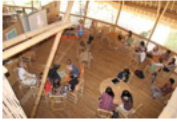
Imagen 10: actividades escolares en Green School de Bali.

Tras la visita inspiradora a estas iniciativas, queremos volver la mirada hacia los contextos más habituales, la familia y la escuela, desde las que se debe fomentar el contacto y respecto al medio natural. Por ello hablaremos de ideas para acercar a niños y niñas a la naturaleza.