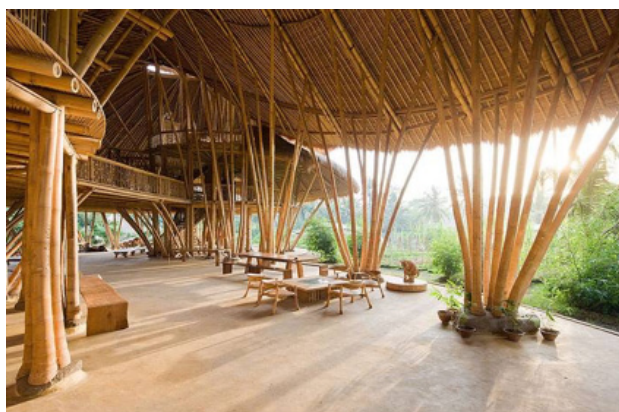
Imagen 8: arquitectura de bambú en la Greenschool de

La Green School de Bali se esfuerza por ser lo más independiente posible de energía, mientras que la construcción de edificios verdes utilizando materiales naturales, principalmente bambú, hierba y barro. El campus se compone de varias estructuras que incluyen aulas, un gimnasio, salas de conferencias, la vivienda, oficinas, cocina, cafetería y un cuarto de baño. Ocupa un espacio de 7542 metros cuadrados. El proyecto arquitectónico fue nombrado finalista en el premio Aga Khan de Arquitectura en el 2010.