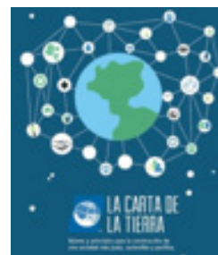
Imagen 3: Carta de la Tierra, documento.

educativo muy valioso que debería estar presente en todos los centros. Así damos acceso a una versión imprimible de la misma.