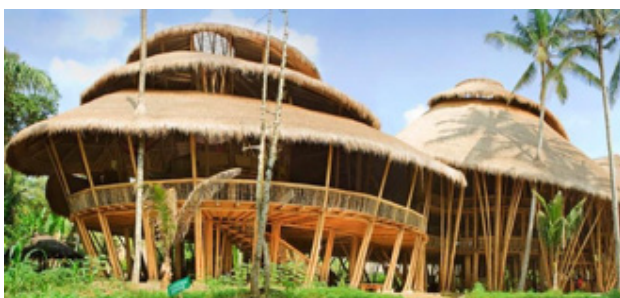
Imagen 7: Edificios principales Campus Greenschool