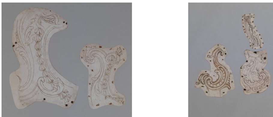
Fig. 8. Oficina Valadier, desenhos para partes de sacras. Lápis e tinta castanha. 480 x 520 mm e 300 x 410 mm, respectivamente. Antichità Alberto Di Castro, Roma.

Os desenhos de componentes, frequentemente de motivos decorativos, mas por vezes também de soluções formais recorrentes, são reconhecíveis com relativa abundância no contexto do conjunto por nós estudado, sendo por vezes relativamente fácil identificar a sua utilização em peças sobreviventes (Fig. 9), sobretudo naquelas integrantes de tipologias mais frequentemente realizadas (relicários, molduras, etc.).