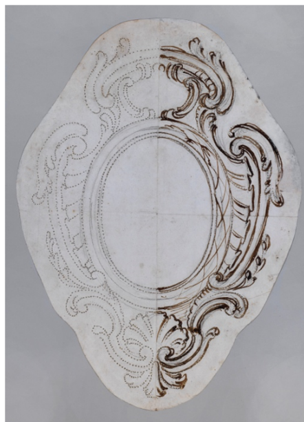
Fig. 7. Oficina Valadier, desenho para moldura oval. Lápis, tinta e aguada de castanho. 365 x 270 mm. Antichità Alberto Di Castro, Roma.

Seguidamente abordaremos três tipos de desenhos que configuram duas diferentes situações: o uso múltiplo (um mesmo desenho é utilizado para a feitura de múltiplas obras) e o uso único. Para a primeira situação consideraremos os desenhos perfurados e os desenhos de componentes, enquanto que para a segunda abordaremos os desenhos com anotações.