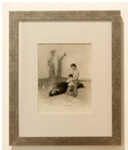
"A derradeira lección do mestre", álbum Galicía mártir (Museo de Pontevedra)

Neste apartado está singularizado no centro o óleo de 1945 A derradeira lección do mestre (218 x 157 cm). Na parede de enfronte está o debuxo orixinal do álbum Galicía mártir (1937) no que se inspira o lenzo, e que se conserva no Museo de Pontevedra. Este debuxo está flanqueado por dúas imaxes máis Así aprenderán a non ter ideas e Superviventes do mesmo álbum. Ambas dúas resumen o debuxo e dialogan con el. A par do cadro unha listaxe recolle os nome dos cen mestres asasinados ós que acompaña o poema Cunetas de Luís Pimentel.