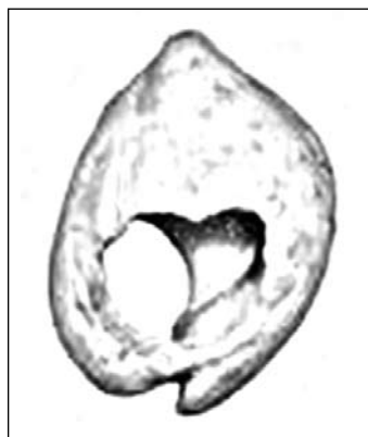
Concha del gasterópodo Nassarius gibbosulus perforada artificialmente. Procede de la cueva de Es Skhul, Israel

En la cueva de Skhul en Israel han aparecido cuentas perforadas de un gasterópodo marino el Nassarius gibbosulus impregnados de ocre, posiblemente algunos de ellos están relacionados con un área funeraria, pertenecientes al Paleolítico Medio del Levante o Próximo Oriente. Su cronología obtenida por diversos medios oscila entre hace 100.000 y 135.000 años.