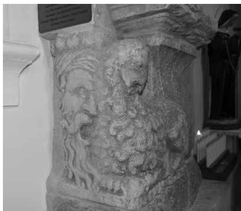
Ill. 3. Comiso (Ragusa), base di portale, attualmente nella chiesa di San Francesco.

Lo slittamento figurativo è palese anche in un altro esempio della stessa area geografica. Un leone stiloforo della città di Noto antica, oggi conservato nella chiesa del Crocefisso, ma forse appartenente all'antica chiesa madre della città distrutta dal terremoto del 1693, stringe fra le zampe non il consueto drago, ma una testina decorata da un turbante. Ciò induce a ritenere che i leoni di Noto non sono affatto medievali ma appartengono al pieno Cinquecento e a un filone diffuso in Sicilia e in Puglia di ripresa di temi romani. Una ulteriore prova si può riscontrare nella base di un portale di Comiso, presso Ragusa. L'opera, attualmente rimontata nella chiesa di San Francesco e già appartenente alla chiesa del Carmine, risale probabilmente agli anni Sessanta del XVI secolo e possiede plinti decorati con leoni stilofori posti ortogonalmente a minacciose teste di ottomani (Ill. 3) 7 .