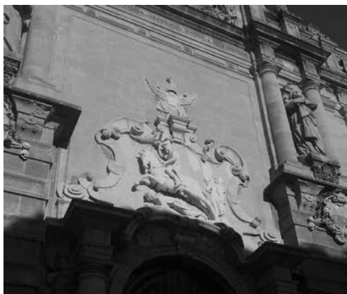
Ill. 6. Mazara (Trapani), cattedrale, rilievo marmoreo sul portale maggiore.

Una iconografia più dichiaratamente “bellica” è quella del rilievo posto nel 1584 sul portale principale della cattedrale di Mazara, dove il mitico conte Ruggero I a cavallo sovrasta un turco abbattuto (Ill. 6). L'evidente sovrapposibilità iconografica con il San Giacomo “matamoros” è giustificabile attraverso la possibile ingerenza del vescovo toledano Bernardo Gasch o anche con la presenza nel cantiere di maestri iberici come Antonino Vizerra o Bizerra, che nel 1589 è nominato responsabile della costruzione del campanile della cattedrale 13 . Quello che comunque conta a Mazara è l'evidente attualizzazione di un episodio del XII secolo: la storia locale viene piegata alla propaganda bellica. La cattedrale di Mazara ha un prospetto rivolto verso il Mediterraneo, la platea a cui si rivolge non è necessariamente cittadina, la raffigurazione sembra costituire un ammonimento contro gli invasori.