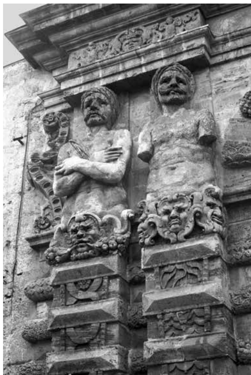
Ill. 8. Palermo, dettaglio delle erme di Porta Nuova.

testa mozzata di Oloferne; riconoscere in questa occasione una allegoria dello scontro tra religioni non è molto difficile.