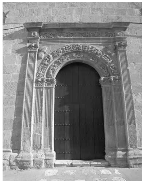
Ill. 5. Sciacca (Agrigento), portale della chiesa di Santa Maria dell'Itria.

La sottomissione e la sconfitta dell'incursores islamico non è comunque sempre manifestatamente esibita. Esistono casi precedenti – come ad esempio il portale della chiesa di Santa Maria dell'Itria a Sciacca (1550 circa) (Ill. 5) – dove i rozzi profili di un "turco" e di un occidentale si fronteggiano in modo paritario (e con analogo grado di terribilità), come in una rappresentazione teatrale o in una messa in scena degli eroi della Gerusalemme Liberata. Questa contrapposizione "paritaria" tra nemici si ritrova, con più raffinata qualità esecutiva, nella Porta dei Greci di Palermo, realizzata, probabilmente su progetto dell'architetto spagnolo Pedro Padro, intorno al 1555 come manifesto allegorico della vittoria riportata in Tunisia con la presa di Città d'Africa 12 .