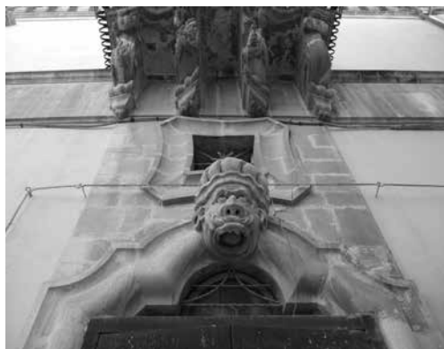
Ill. 9. Scicli (Ragusa), dettaglio di palazzo Beneventano.

Abbiamo fin qui individuato in un periodo concentrato, che copre pressappoco l'arco di una generazione, tra il 1560 e il 1585, il periodo in cui si manifesta in maggior misura la rappresentazione del "turco" in nuove architetture siciliane. Le raffigurazioni sono articolate in varianti