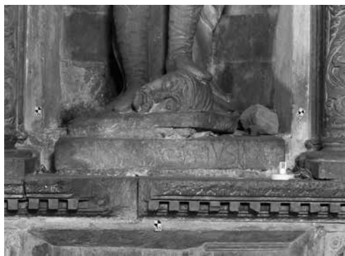
Ill. 2. Ragusa, chiesa di San Giorgio, particolare della "cona".

lustrata nei I dieci libri dell'architettura di Daniele Barbaro 3 . Le nicchie risultavano articolate da colonne libere scanalate ed erano predisposte per contenere una serie di statue di santi (se ne conservano tre, due delle quali ancora nella relativa nicchia) in posa eroica e in armatura cinquecentesca che poggiano il piede sulla testa mozzata di un turco (Ill. 2). Al centro, la nicchia maggiore presenta la consueta iconografia del San Giorgio a cavallo e del drago, ma anche in questo caso la corazza del santo è manifestamente contemporanea. Se si tiene conto che, mezzo secolo prima, nell'altare della Nazione Genovese nella chiesa di San Francesco a Palermo, il santo era stato rappresentato da Antonello Gagini (padre di Antonino) in abiti romano-antichi, la scelta di una attualizzazione appare determinata da nuove precise indicazioni. In realtà, dalle nicchie dell'altare maggiore del duomo di Ragusa emergeva una parata di vittoriosi guerrieri, guidati da un San Giorgio del XVI secolo.