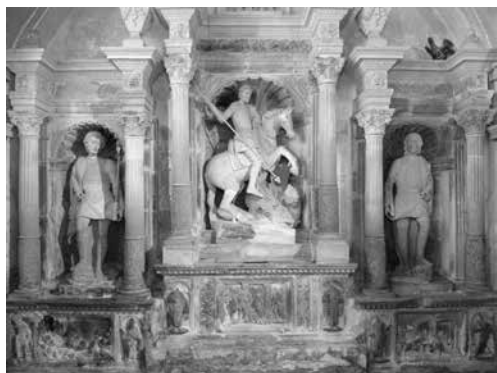
Ill. 1. Ragusa, chiesa di San Giorgio, frammenti della "cona" di Antonino Gagini.

lustrata nei I dieci libri dell'architettura di Daniele Barbaro 3 . Le nicchie risultavano articolate da colonne libere scanalate ed erano predisposte per contenere una serie di statue di santi (se ne conservano tre, due delle quali ancora nella relativa nicchia) in posa eroica e in armatura cinquecentesca che poggiano il piede sulla testa mozzata di un turco (Ill. 2). Al centro, la nicchia maggiore presenta la consueta iconografia del San Giorgio a cavallo e del drago, ma anche in questo caso la corazza del santo è manifestamente contemporanea. Se si tiene conto che, mezzo secolo prima, nell'altare della Nazione Genovese nella chiesa di San Francesco a Palermo, il santo era stato rappresentato da Antonello Gagini (padre di Antonino) in abiti romano-antichi, la scelta di una attualizzazione appare determinata da nuove precise indicazioni. In realtà, dalle nicchie dell'altare maggiore del duomo di Ragusa emergeva una parata di vittoriosi guerrieri, guidati da un San Giorgio del XVI secolo.