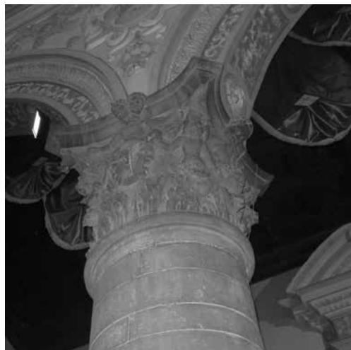
Ill. 4. Enna, chiesa madre, capitello di Giandomenico Gagini.

In realtà sono molteplici i casi in cui le incursioni piratesche, l'islamismo, l'eresia in generale, il peccato – le ultime due nelle forme tradizionali di esseri mostruosi – sono accomunati da una