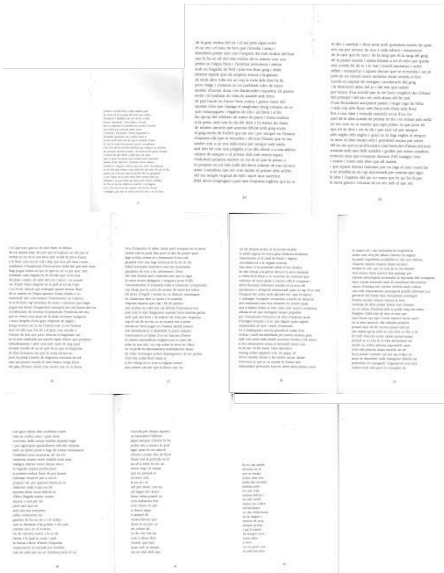
Fig. 1-5. Suicidio textual da segunda parte. Víctor Sunyol. Ni amb ara prou (1984)

Como comenta o autor nas notas preliminares que guían a lectura do poema, «el text en el seu acompliment com a "text", troba la pròpia mort, i s'aboca irremediablment al suïcidi. La tercera part en seria la ressurrecció ( al tercer dia ), impossible i alhora inútil» (Sunyol 1984: 9). Porque, en definitiva, este é un «poema que se suicida», nas palabras do propio autor, un poema que leva a linguaxe até o límite, até o silencio dunhas palabras que xa non poden máis que desaparecer ou balbucear: