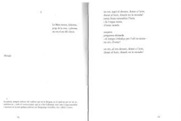
Fig. 9-10. Exemplo da disposición gráfica da obra. Víctor Sunyol, Stabat (2003)

Así como «Stabat mater dolorosa / juxta crucem lacrimosa / dum pendebat filius», segundo o primeiro terceto en latín de Jacopone da Todi recollido por Sunyol (2003: 13), o poeta sitúa a poesía e a si mesmo no límite dunha paixón que xa non mostra o burato da linguaxe senón que a perfora por completo. Mostra o oco da linguaxe en tanto que ferida e chaga dunha palabra que, como Cristo salvador, vén salvarnos desde a realidade sufrinte e dolorosa da fala; dunha fala espida e despoxada de todo, que morre para dar vida e salvar do pecado a todos os homes, especialmente a aqueles que pecan coa lingua e, por iso mesmo, teñen «orellas para escoitar» (Mt 13, 16). «La consciència de la realitat del llenguatge, el dolor que comporta, sofriment, per la pèrdua d'algun desig entrevist en el qual es confiava en excés» —así o describe Sunyol na poética que acompanya ao poema que ten como motivo principal a dor, mais engadindo a seguinte nota discursiva: «és la mirada —la consciència— allò que obre (o constata) la ferida i la fa dolorosa» (Sunyol 2003: 18)—. O que fai, pois, a mirada daquel cego de Tebas é abrir a ferida e facela sangrar, así como sangran os cravos cravados na pel do crucificado: «ara, el cos en dolor pels ulls que es miren», acaba dicindo o poema en cuestión. O verso, seguindo a vontade do autor de só usar as partícules mínimas da lingua, faise cada vez máis condensado, até chegar a dicir cousas como esta: