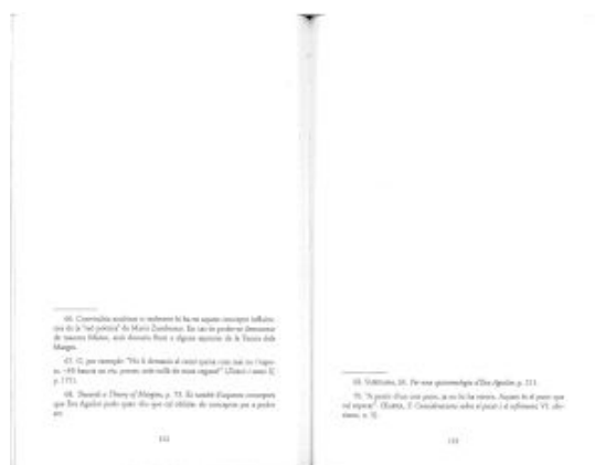
Fig. 7. Exemplo de páxina. Víctor Sunyol. Cap a Tirèsies (1997)

Cita de Cap a Tirèsies de 1997, ensaio-ficción que, xunto co ensaio-collage de El buit i la novel·la de 1994 —unha obra que reúne só a primeira e derradeira frases dunha serie de novelas máis ou menos canónicas—, é a proposta de ofrecer ao lector un libro sen texto ou un libro cuxo corpo do texto ten sido baleirado (fig. 7-8). Desta vez, o paradoxo consiste en pór a centralidade nas marxes; nas brechas e intersticios dunha palabra que xa non di senón que, máis ben, fai silencio.