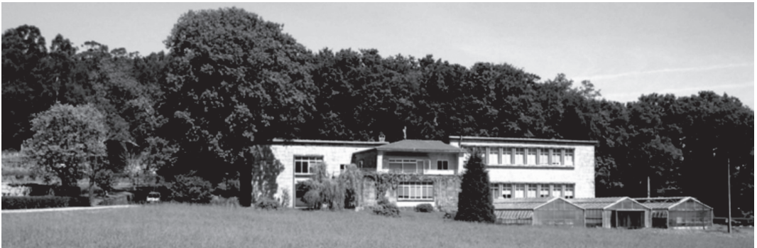
Figura 2. Misión Biolóxica de Galicia, no Pazo de Gandarón (Salcedo, Pontevedra).