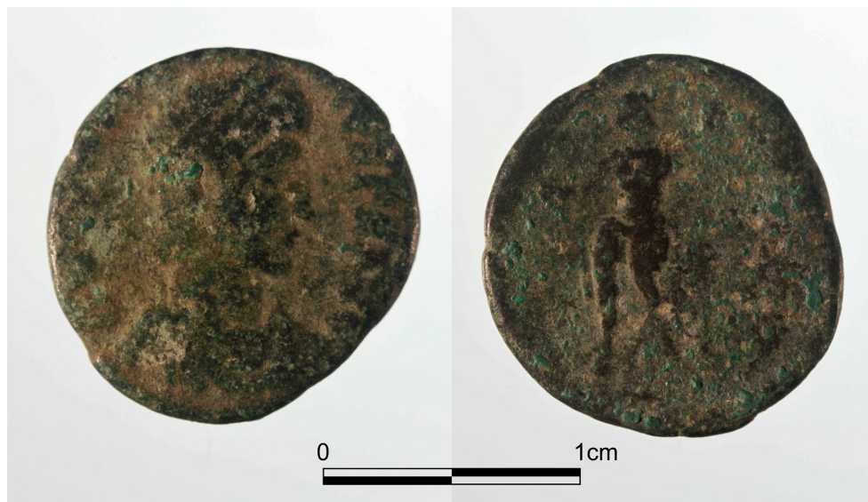
Figura 3. Follis perteneciente a la última etapa del reinado de Constancio II.

No cabe duda de que los ejemplares hallados corresponden a dos pequeñas monedas tardoimperiales que la investigación numismática clasifica como follis o moneda de velón. Estas piezas van perdiendo gradualmente, desde el inicio del reinado de Constantino, aquel 4% de plata que en rigen había fijado la reforma monetaria diocleciana del año 294. De este modo, a la postre únicamente el bronce restará como material integrante.