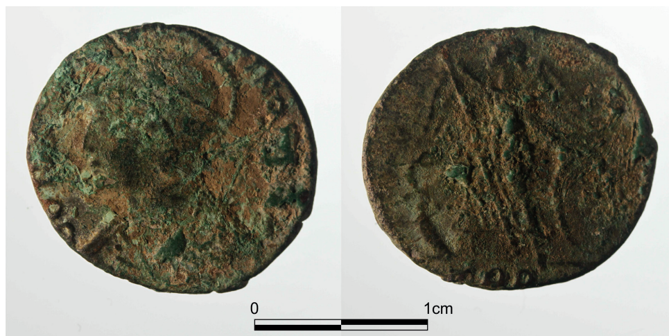
Figura 2. Follis conmemorativo de la fundación de Constantinopla acuñado en Tréveris.

Referencia bibliográfica: RIC VIII , pp.34 y 142-43.