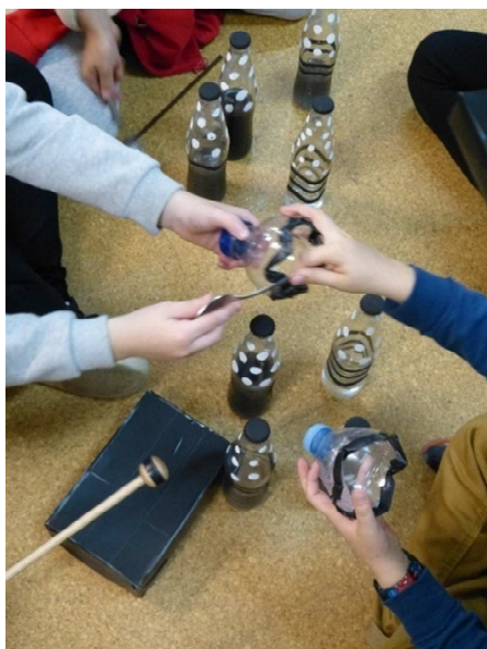
Fig 4 y 5. Ejemplos de cotidiáfonos.