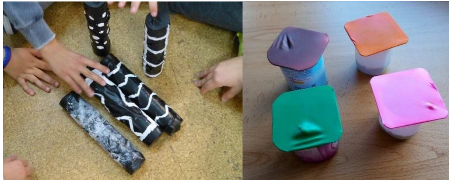
Fig 1. 2 y 3. Ejemplos de cotidiáfonos y materiales para su construcción.

emplear como son campanas, llaves, escobas, tijeras, monedas, piedras, cremalleras, silbatos, monedas, troncos, cuerdas, cascabeles, papel celofán, vasos, secadores, agua, canicas o pelotas.