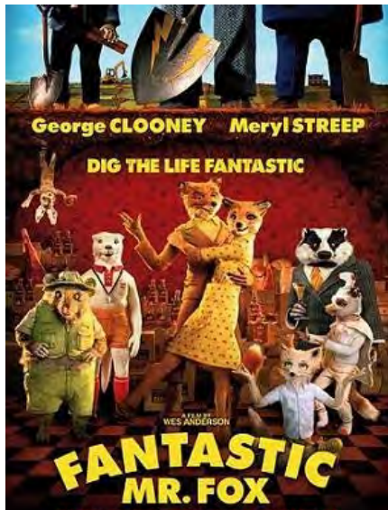
Figura 2: cartel promocional

Fantastic Mr. Fox , de Roald Dahl, es una versión moderna de la fábula de animales protagonizada por el zorro Reynard que, según Mendlesohn y Levi (2016: 13), “it teaches people to