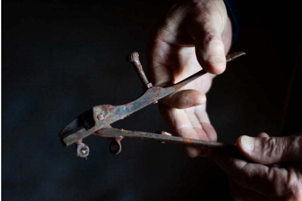
Figura 2. Quinta das 7 fotografías que integran a primeira parte do libro (“ter conta”)

Nunha proporción moi importante de poemas, as mans, o traballo manual, o tacto van enfiando a súa secuencia narrativa. E como na poesía de Carlos Negro nada é casual, o libro péchase con dous pequenos textos que acariñan as mans cunha aliteración de fariña e amor: “as cóxegas na palma da mau polo farelo que cae do bico da peneira / ter conta delas ” e “chaves de paso as maus ”, así como cunha derradeira fotografía en cor (Figura 3) da mesma serie que as que integraban a primeira parte do libro.