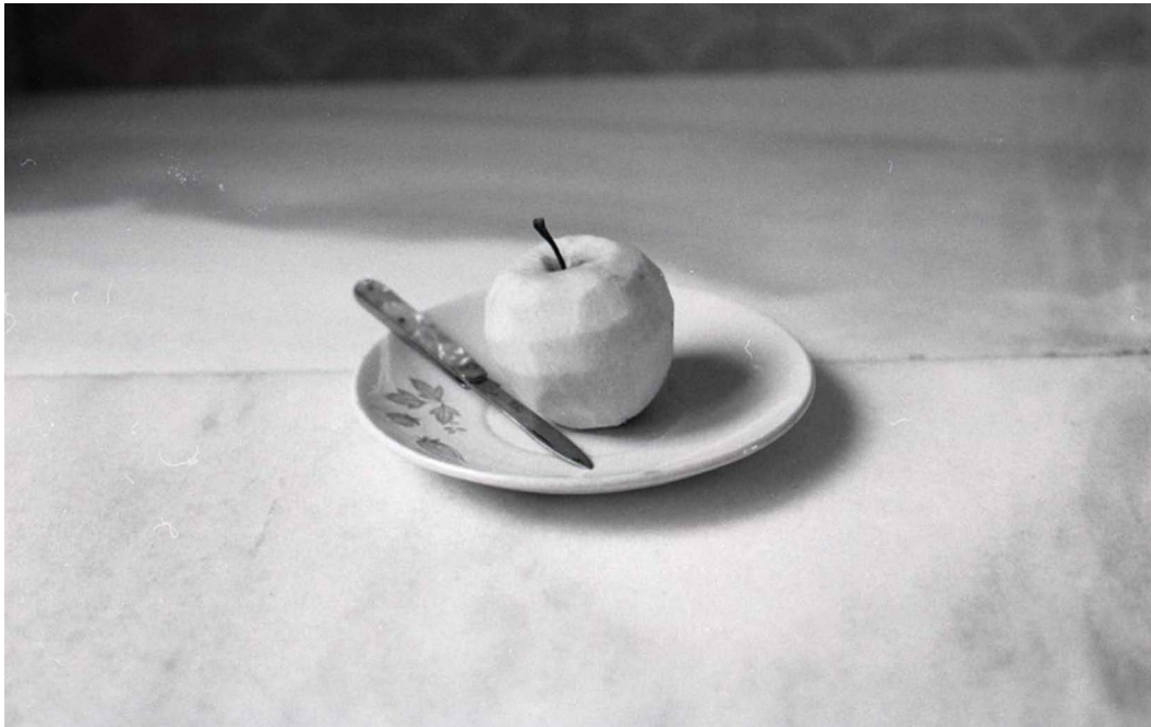
Figura 6. Última das 7 fotografías que integran a penúltima parte do libro (“prana”)

Teño para min que Carlos Negro vai seguir explorando nos vindeiros anos novos territorios, novos microcosmos poéticos, desde unha palabra sempre comprometida co seu tempo e coas súas raiceiras. Deses dous mananciais bebe a súa obra: da fidelidade á súa orixe e da solidariedade coas causas xustas que reclaman a súa atención como poeta de denuncia, comprometido socialmente. Non debemos esquecer a vocación docente do noso autor. E ese estar en contacto sempre coa rúa, coa sociedade, coa escola fai que a súa obra fale de cada un de nós con palabras nas que nos recoñecemos, con palabras que son nosas e que el ordena co maxisterio que lle dá ser un dos poetas de voz máis recoñecible e celebrada da poesía galega das dúas últimas décadas.