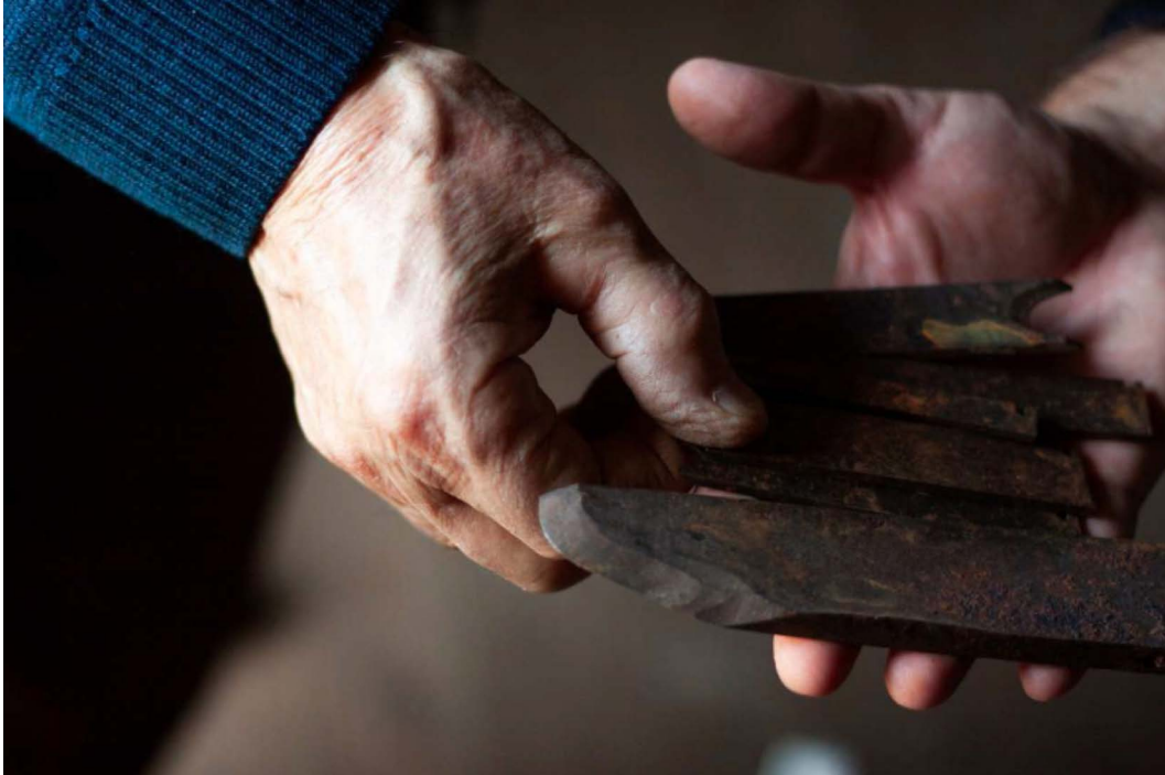
Figura 3. Fotografía que pecha o poemario

Ter conta delas porque hai que termar do que atesouran, pero tamén porque hai que contar o que nos din. E nesa lectura das mans, o traballo de Benxamín Otero crea unha luz narrativa que conta en paralelo, que nos abre a porta a un pasado e a unha conciencia de pertenza a un lugar e a un tempo. A prana no prato é o resultado dunha habelencia manual que se dignifica neste libro. Unha habelencia que resulta inimitable no oficio de escritor: “ningún verso a esa altura”.